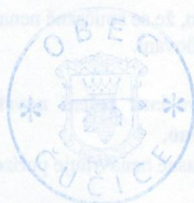
Otisk razítka obce